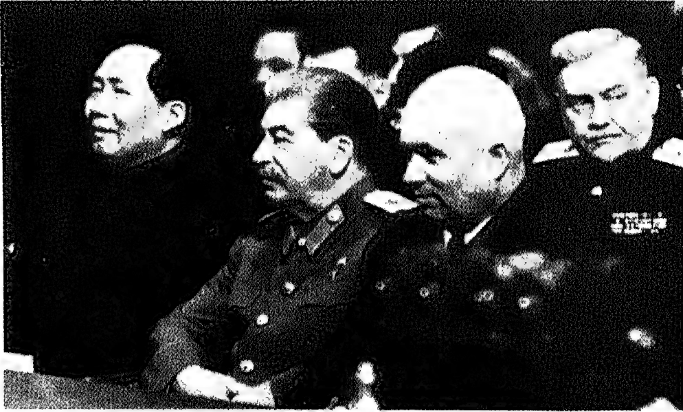
آخر أيام ستالين، أثناء استقباله ماو تسي تونغ في أول زيارة له إلى الاتحاد السوفييتي، ويبدو في الصف الأول خروتشوف وفي الصف الثاني بولغانين.